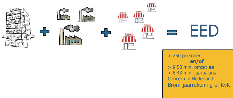
Figuur 1: Onderneming met vestigingen

Uitvoeren van een energie-audit is verplicht voor ondernemingen met meer dan 250 medewerkers, of een jaaromzet groter dan € 50 miljoen, en een jaarlijks balanstotaal groter dan € 43 miljoen. Het gaat daarbij om de totale onderneming. Dit kan dus de optelsom van meerdere vestigingen zijn.